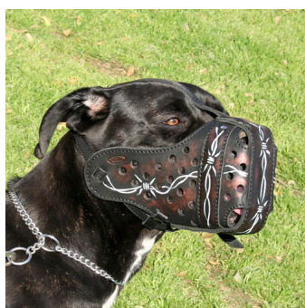
Foto: Bozal perro de trabajo para cane corso