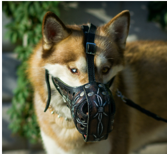
Foto: Bozal de cuero para husky siberiano