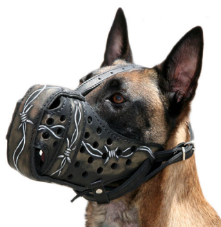
Foto: Bozal adiestramiento decorado