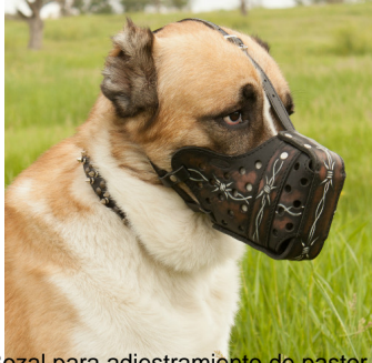
Foto: Bozal para adiestramiento de pastor asiático