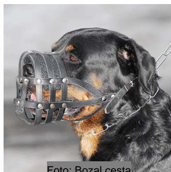
Foto: Bozal cesta

Por favor, tenga en cuenta que no fabricamos bozales a medida. Nuestros modelos se basan en los estándares de la anatomía, sexo y raza del animal. Cuando Usted indica en el pedido las características de su perro, elegimos la talla más apropiada del bozal, de acuerdo a los datos facilitados. Así, posiblemente le enviaremos la talla que mejor se adapte a su perro, según nuestro criterio, y no la que Usted eligió. Si está seguro de que la talla elegida es la correcta, por favor, hágalo constar expresamente en el comentario del pedido.