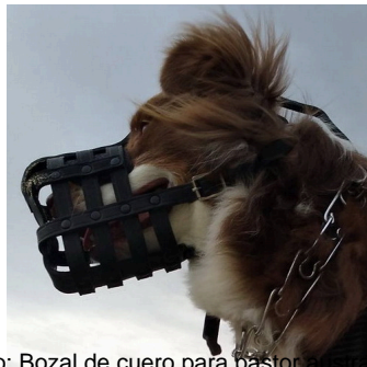
Foto: Bozal de cuero para pastor escocés