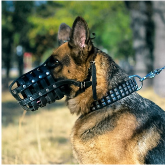
Foto: Bozal de cuero para perro pastor alemán