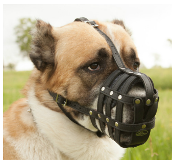
Foto: Pastor del Asia central con bozal de cesta