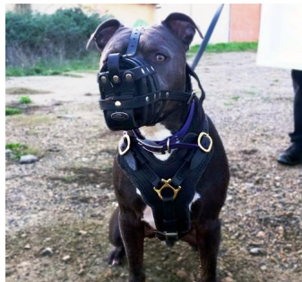
Foto: Bozal cuero grueso de cesta