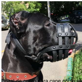
Foto: Bozal de cuero para cane corso pequeño