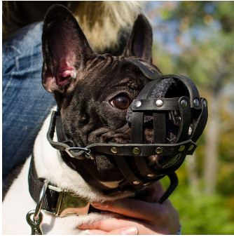
Foto: Bozal canasta