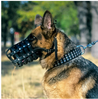
Foto: Bozal de cuero para perro pastor alemán