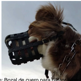
Foto: Bozal de cuero para pastor escociano