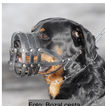
Foto: Bozal cesta

Por favor, tenga en cuenta que no fabricamos bozales a medida. Nuestros modelos se basan en los estándares de la anatomía, sexo y raza del animal. Cuando Usted indica en el pedido las características de su perro, elegimos la talla más apropiada del bozal, de acuerdo a los datos facilitados. Así, posiblemente le enviaremos la talla que mejor se adapte a su perro, según nuestro criterio, y no la que Usted eligió. Si está seguro de que la talla elegida es la correcta, por favor, hágalo constar expresamente en el comentario del pedido.