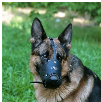
Foto: Bozal de cuero para perro pastor alemán