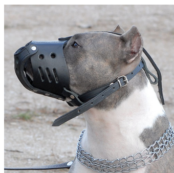
Foto: Bozales caninos para pit bull