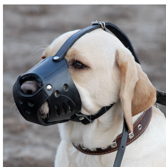
Foto: Bozal canino de cuero natural