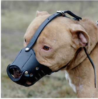
Foto: Bozales de cuero natural de uso cotidiano