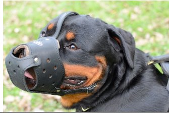
Foto: Bozales de cuero natural rottweiler