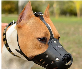
Foto: Bozales de cuero para amstaff