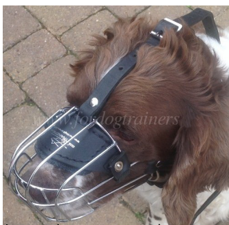
Foto: Bozal cesta de acero cromado para cocker spaniel