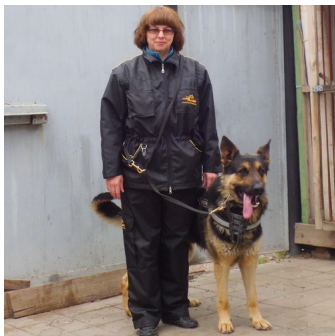
Foto: Correa multiposición para perro