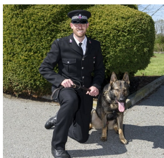
Foto: Correa canina reforzada de cuero extra fuerte