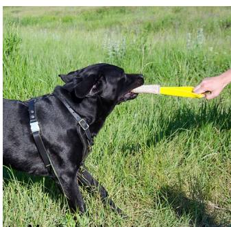
Foto: Mordedor de yute para cachorros