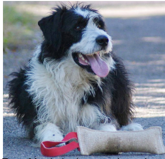
Foto: Mordedor juguete de cachorro