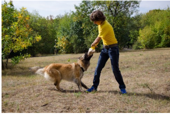
Foto: Motivadores cachorros para Tervuren