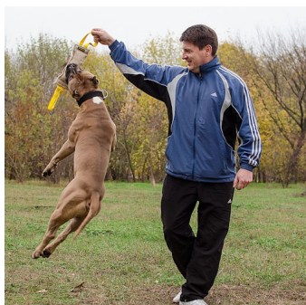
Foto: Entrenamiento de Amstaff con mordedores perros