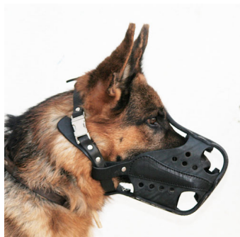
Foto: Bozal de cuero para adiestramiento de perros