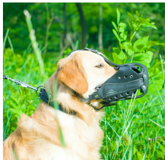
Foto: Bozal de cuero para perro golden retriever