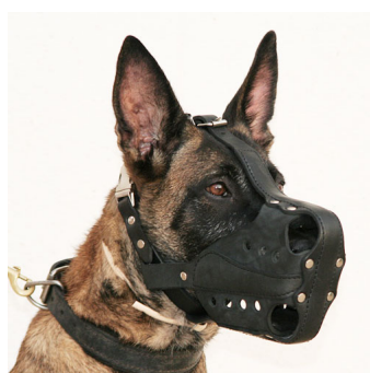
Foto: Bozal cuero para perros de las razas malinois, pastor alemán