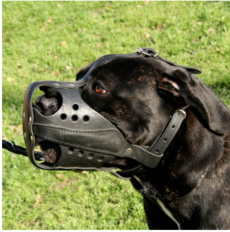
Foto: Bozal adiestramiento perros para cane corso