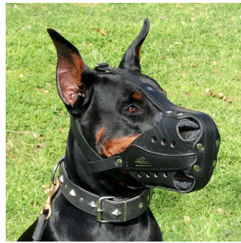
Foto: Bozal cuero perros dóberman