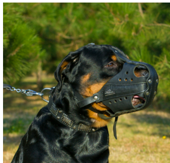
Foto: Bozal de cuero para perro rottweiler