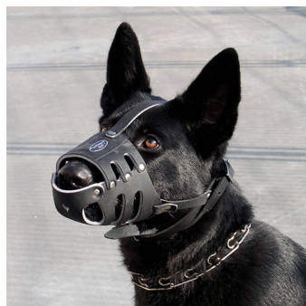
Foto: Bozal para varias razas de perro