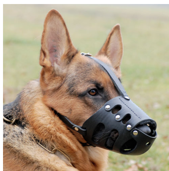
Foto: Bozal de paseo